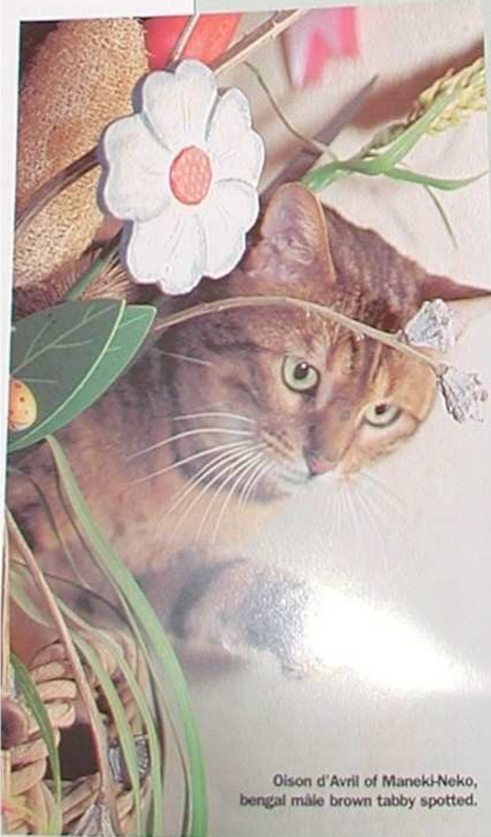
Oison d'Avril of Maneki-Neko, bengal mâle brown tabby spotted.